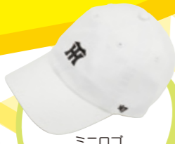
ミニロゴ 47CLEAN UP ¥3,500