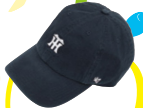
ミニロゴ 47CLEAN UP ¥3,500