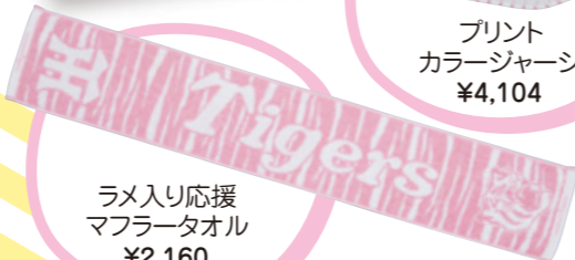
ラメ入り応援 マフラータオル ¥2,160