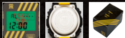
バックライト点灯時 裏面 パッケージ