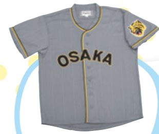
復刻ユニフォーム ¥4,500