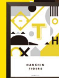
[03] BASEBALL PARTY