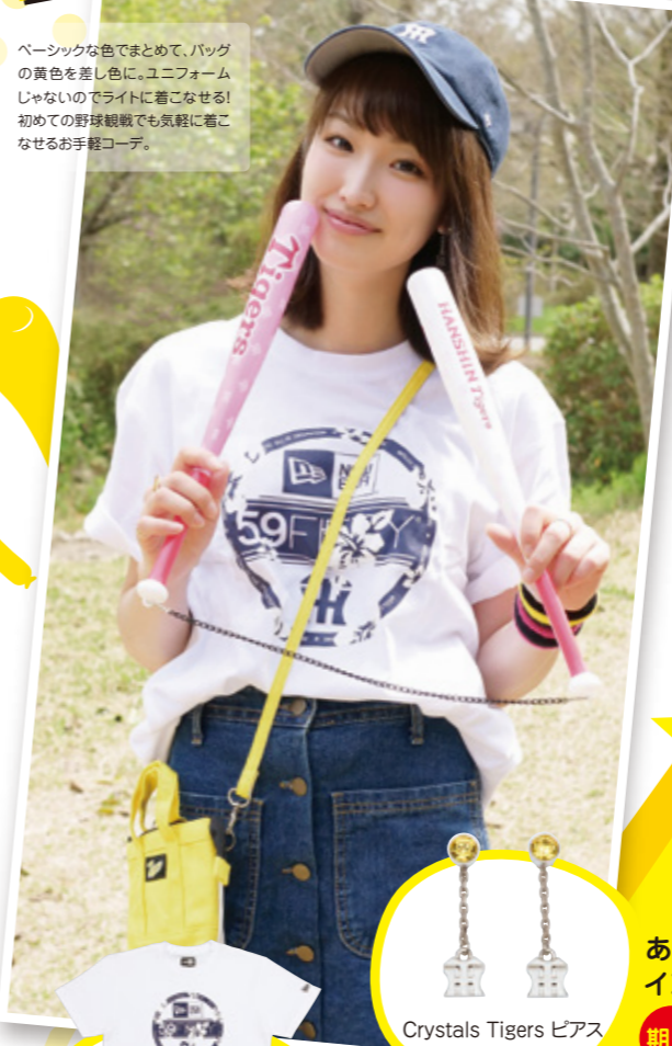
ハイビスカスTシャツ ¥4,104

ベーシックな色でまとめて、バッグ の黄色を差し色に。ユニフォーム じゃないのでライトに着こなせる! 初めての野球観戦でも気軽に着こ なせるお手軽コーデ。