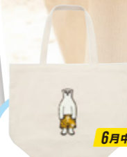
tigersXbenjamin トートバッグ ¥2,700

どんなボトムにも合わせや すい大人カラーのユニフォー ムスタイル! 可愛めの小物を取り入れて 遊び心もプラス!