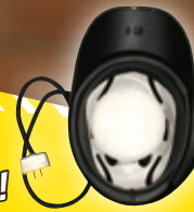
ランブシェード内側