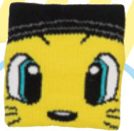
ビッグフェイス リストバンド ¥920