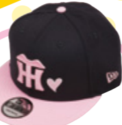
9FIFTY CAP ¥5,500