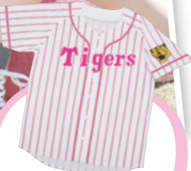
プリント カラージャージ ¥4,104

本気で応援するけど、可愛さも 忘れない!そんなオシャレ TIGERS女子に、しっかりロゴ も取り入れた、大人可愛い欲 張りコーデ。