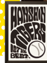
[05] TIGERS IS THE BEST