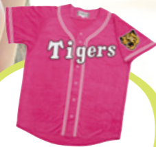
パイル地 レプリカユニフォーム ¥5,940

女の子らしく可愛く応援! ビビットなピンクも、白い キャップとバッグでうまく まとめれば、可愛いスタイル にだれでも簡単に着 こなせるお手軽コーデ。