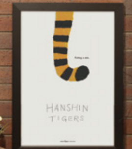
[02] TIGERS TAIL