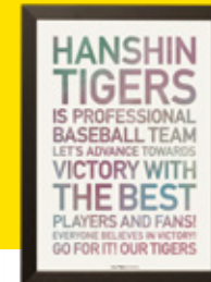
[04] BELIEVES IN VICTORY